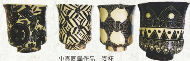
小高同學作品—陶杯