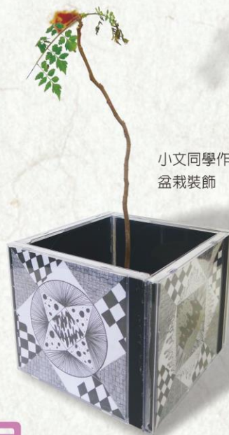
小文同學作品— 盆栽裝飾