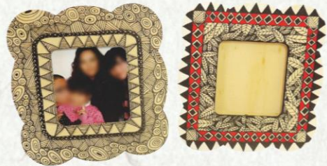
小高同學作品—相框