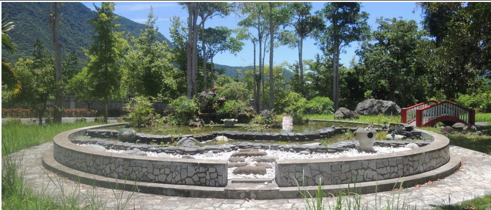
法務部矯正署泰源技能訓練所政風室編撰