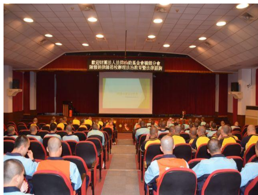
109 年 1 月 21 日本校與法律扶助基金會橋頭分會 舉辦「毒品、性侵及詐欺案觸法內涵」宣導