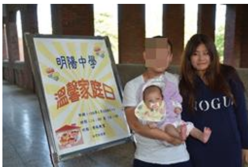
學生與家屬合照情形