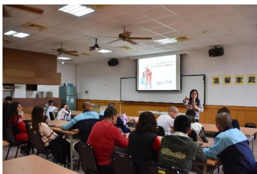
109 年 1 月 20 日家庭溫馨日講座辦理情形 1