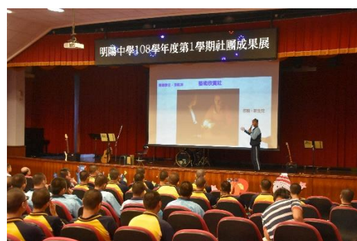
藝術欣賞社演出情形