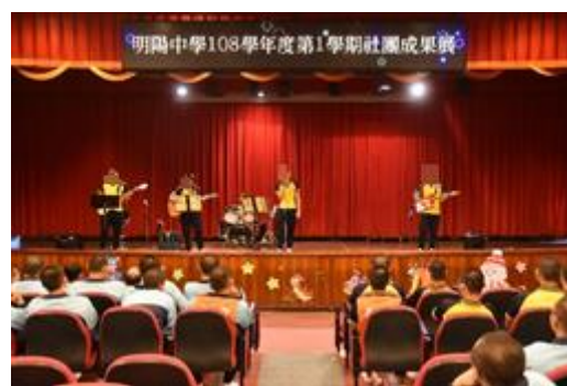
熱門音樂社演出情形