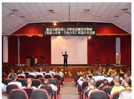
109年1月7日辦理「美國雅威心」音樂佈道團教化活動