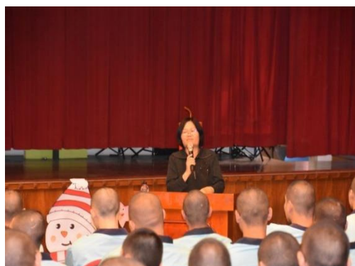
講座深入淺出案例分享