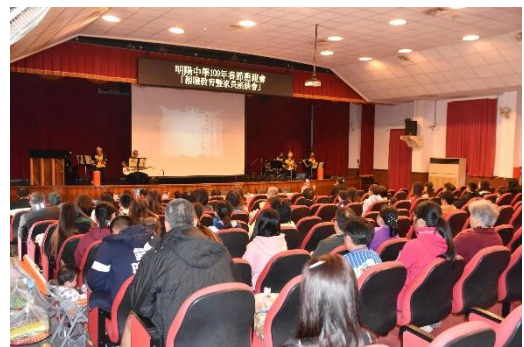
熱門音樂社5名學生演唱情形