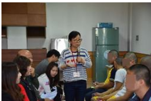
親子交流-學生與家屬互動情形