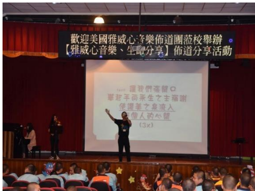
張牧師深入淺出案例分享