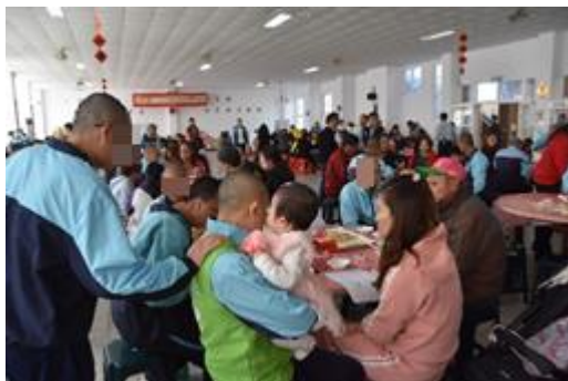
收容學生與家屬團圓餐會情形