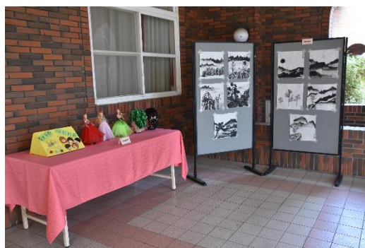
109年1月6日成果展禮堂門口陳列社團作品情形(1)