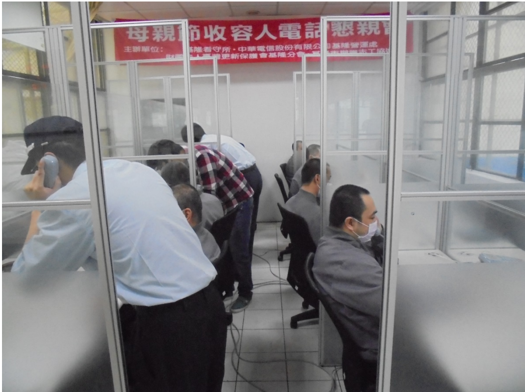
111年4/28日收容人以1電話祝福母親或太太「母親節快樂」