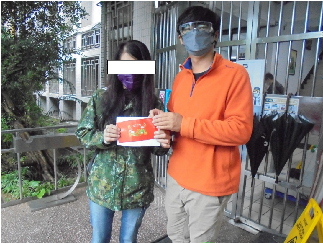
本所致贈全聯禮券，協助突然陷入經濟困難的家庭暫度生活危機。