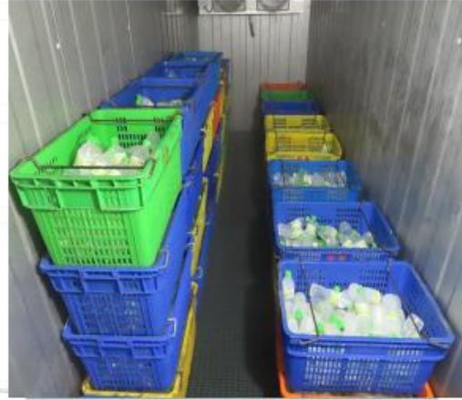
111年第3季法務部矯正署 桃園監獄外部視察小組會議