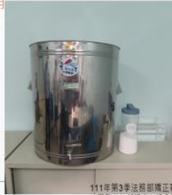
111年第3季法務部矯正署 桃園監獄外部視察小組會議