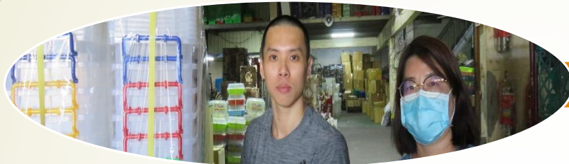
創贏企業股份有限公司