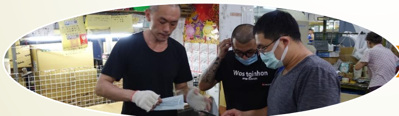
楠億工業有限公司