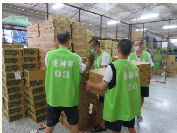
委辦部(合作社僱工)