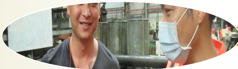
立國實業股份有限公司