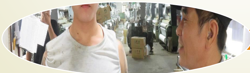
佳林精密紡織股份有限公司