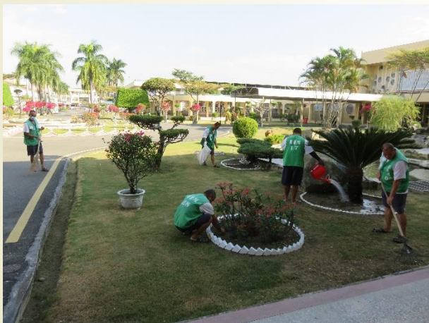
農藝隊(總務科僱工)