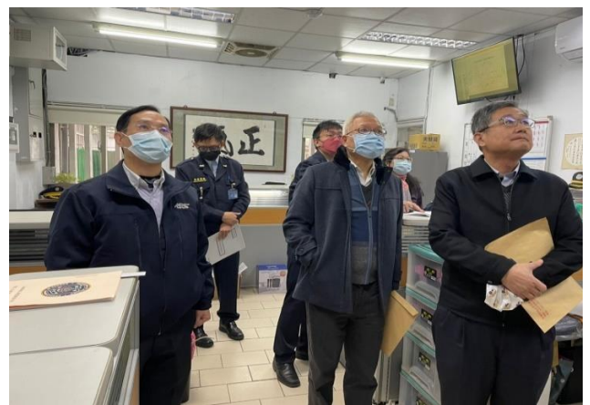
監視螢幕查看收容人門診