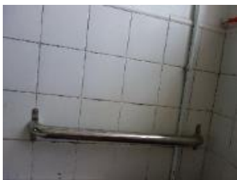
舍房廁所安全扶手 5 間