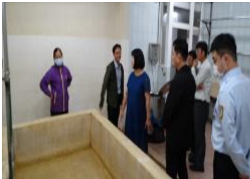
詢問學生夏冬季盥洗方式及設施