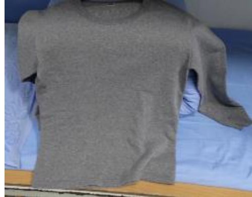
學生可請家屬寄入保暖內裡衣物