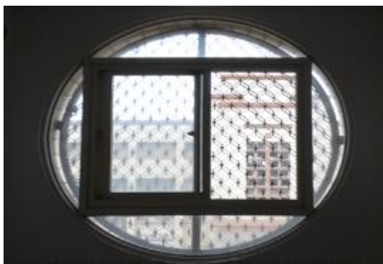
走廊原密閉式窗戶，更換為窗型，可 隨氣候變化機動開關