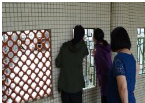
查看送物電梯工程施作情形