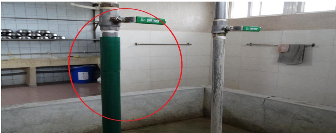
冬季可使用溫熱水洗澡盥洗