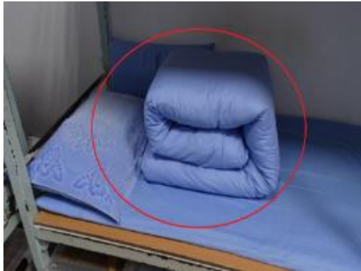
班級已更換冬季被具