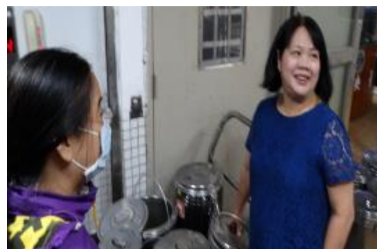
查看學生中餐伙食供應情形