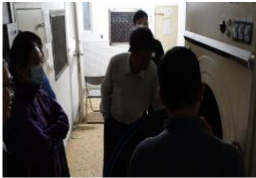
查看學生冬季烘衣設備(烘衣機)