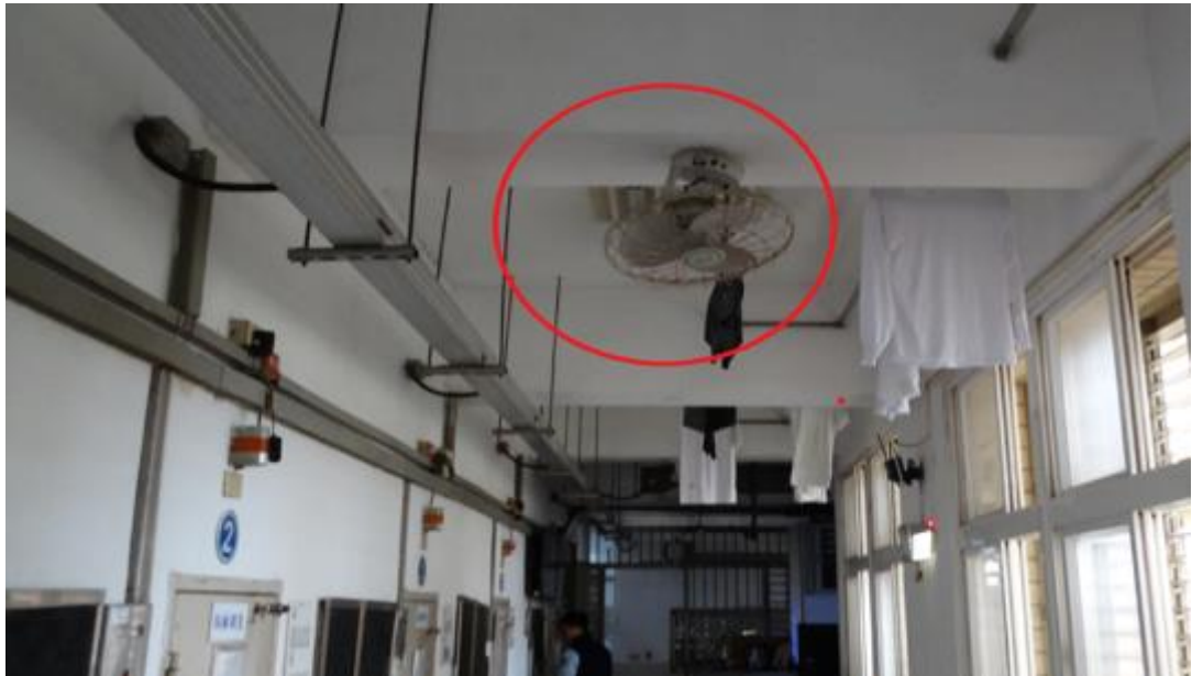
各舍房走廊皆設有旋轉風扇，協助通風排熱