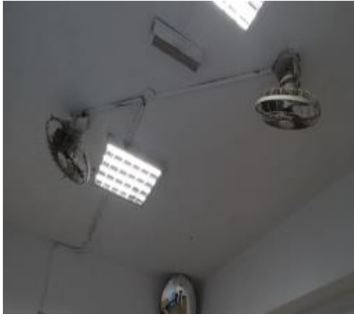
設有旋轉風扇 2 隻及抽風扇 1 隻 學生舍房(台室)