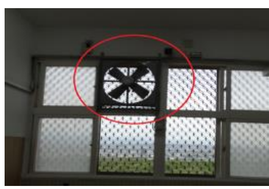
二寢三樓舍房走廊，增設大型排抽風 扇，協助排熱通風