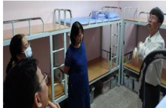
查看學生舍房通風情形