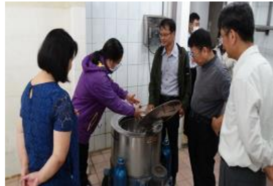
查看衣物洗滌設備(脫水機)