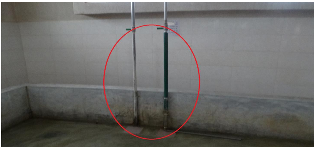
冷熱水管可實際氣候溫度，隨時交替使用，保護學生健康