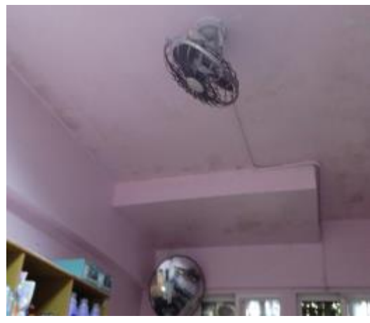
設有旋轉風扇 1 隻及抽風扇 1 隻 學生舍房(和室)