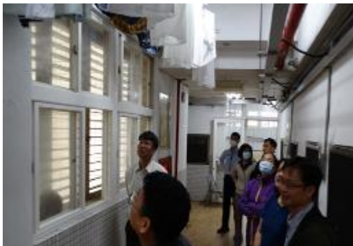
查看學生衣物晾塞及通風情形