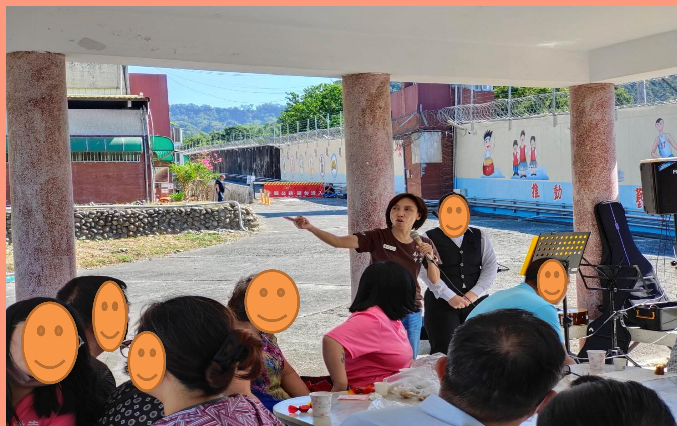
與家人吹著徐徐微風 享用學生自己製作的小點心