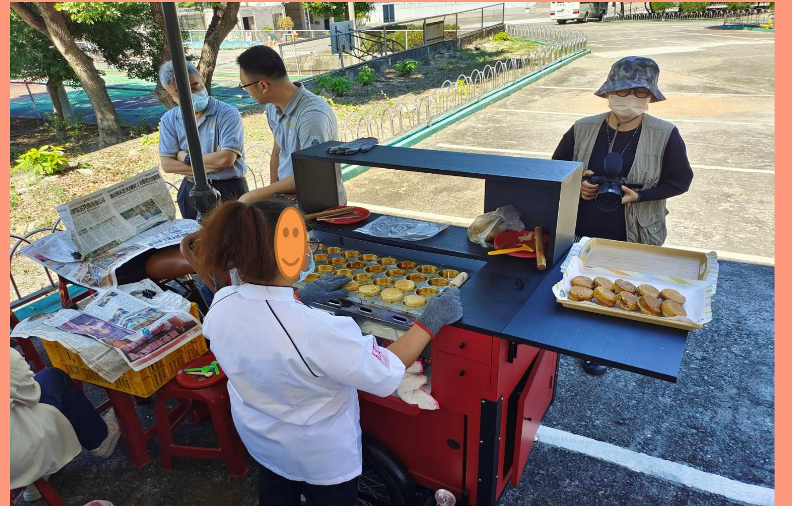
有溫度的現場點心製作