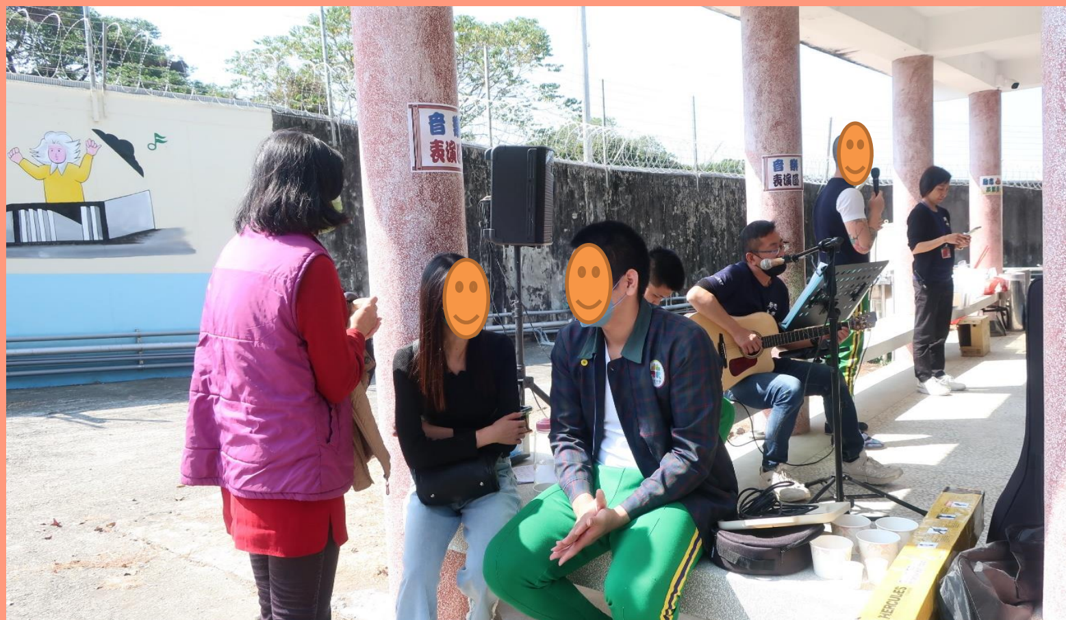
聊心事聊未來規劃