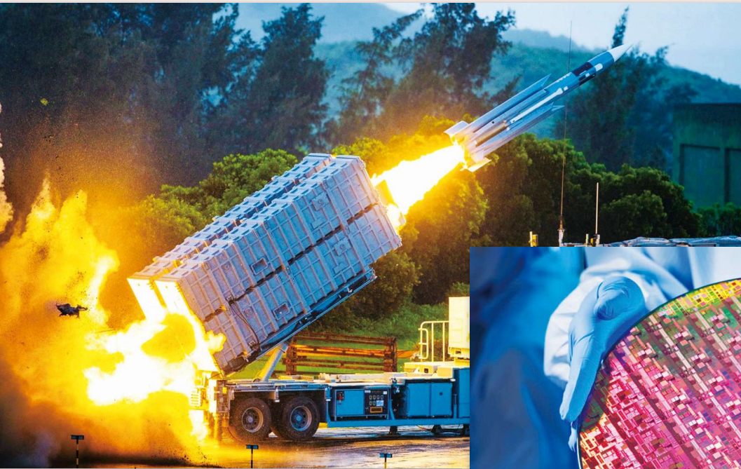
基於國防需要研發的技術或可促使我國產生領導型的技術皆為關鍵技術的範疇，如具備衝壓引擎技術的超音速反艦飛彈或半導體積體電路製造技術。