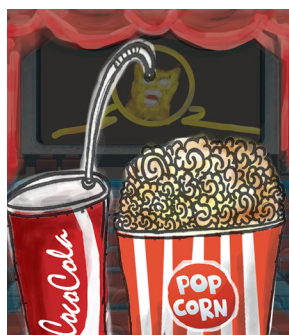
圖 / 文 王○閱 (望)

小時候只要平日在學校都表現得很好，假日媽媽就會帶我去電影院看電影，國小的時候經常每週去一次，但到快升國中的時候就沒再去了，不是因為表現不好，而是因為我媽發現我們母子倆看到後面都會睡著，所以我媽就說不要浪費錢了。