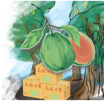
圖 / 文 林○祺 (恭)

我們家每隔二至三個月都會回到奶奶的老家，那兒有不少的農地，而我們家種的是芭樂，每當我們回到那充滿田園氣息的地方，就會有數不盡的芭樂。現在每看到芭樂，就會想起兒時的回憶。