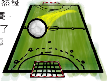
圖 黃○豪、文 陳○堯 (仁)

這個地方有我從小到大的回憶，從我小學 2 年級直到國中畢業，不管我在何處比賽，家人們都會來觀看，也很支持我從事這項運動，這項運動就叫——手球。小的時候我不常和爸爸相處，但有天突然發現他會偷偷來看我的比賽，我也因此和我爸漸漸拉近了距離。手球不只是我的專長項目，更是我這輩子最愛的運動。