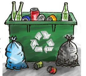
圖 / 文 蔣○利 (愛)

從我有記憶起，爸爸就不在，只有媽媽一個人養育我們四個小孩，因為年紀的問題，媽媽無法找到工作，為了能開源節流，她只能四處去撿回收賺錢，並一邊照顧我們。媽媽的工作或許是許多人不喜歡做的事，但我不覺得丟臉，因為她是真正靠自己雙手工作、賺錢、養育一家人。