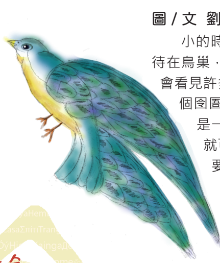
圖 / 文 呂○韜 (智)

小的時候媽媽常告訴我：我是一隻小鳥，待在鳥巢，要快點長大，每當我看向天空，就會看見許多鳥在天空飛翔...。後來我進入了這個囹圄之地，我媽媽又鼓勵我，說我現在是一隻翅膀受傷的鳥，等傷口癒合時，就可以重新展翅、自由飛翔，一直叫我要努力加油。每當我看見鳥，我就會想到最愛我的媽媽，希望有朝一日，我可以和媽媽一起自由飛翔。