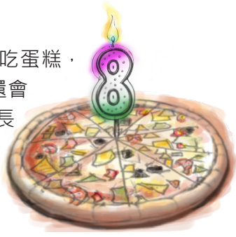
圖 / 文 藍○恩 (儉)

還記得小時候因為我不喜歡吃蛋糕，所以每次過生日時都會買披薩，還會把生日蠟燭插在披薩上面，直到長大後叔叔還是會在我生日那天買披薩回家幫我慶祝。