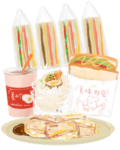
圖 / 文 林○誠 (信)

直到早上 7 點多我才去上學。那是一段睡眠惺忪的歲月，有時也很想再多睡一下。時間過得很快，轉眼間早餐店的點點滴滴成為一種溫暖安全的味道，也是我跟阿嬤永恆的回憶。