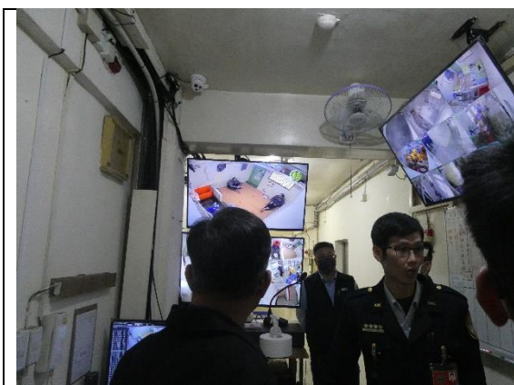
委員訪視明舍收容情形