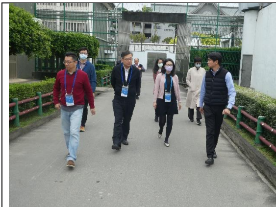
外部視察小組委員訪視戒護區

原訪視廚餘處理機建置，經建安委員提議改訪視明舍，請所方配合辦理。(訪視情形-略)