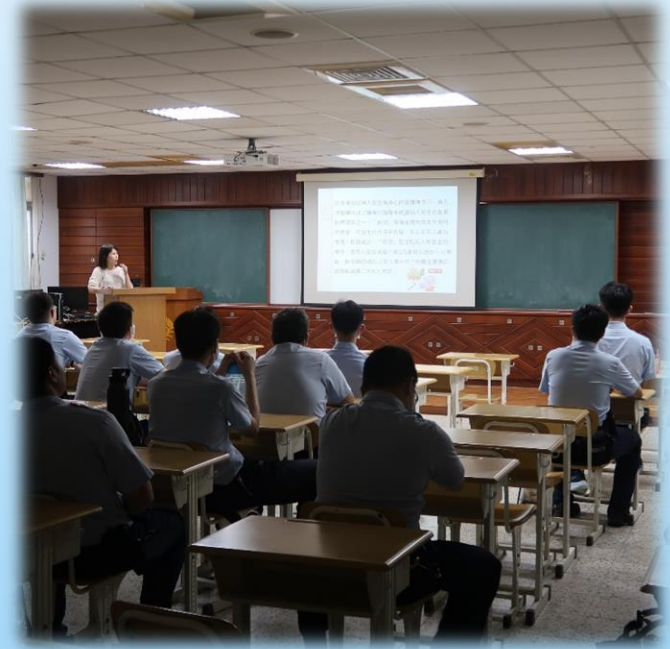
高齡收容人照護課程上課情形