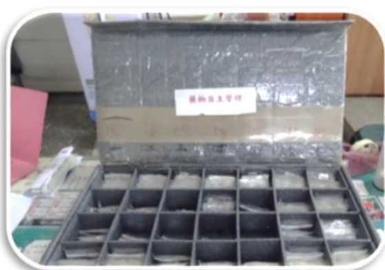
一般藥物自主管理藥箱