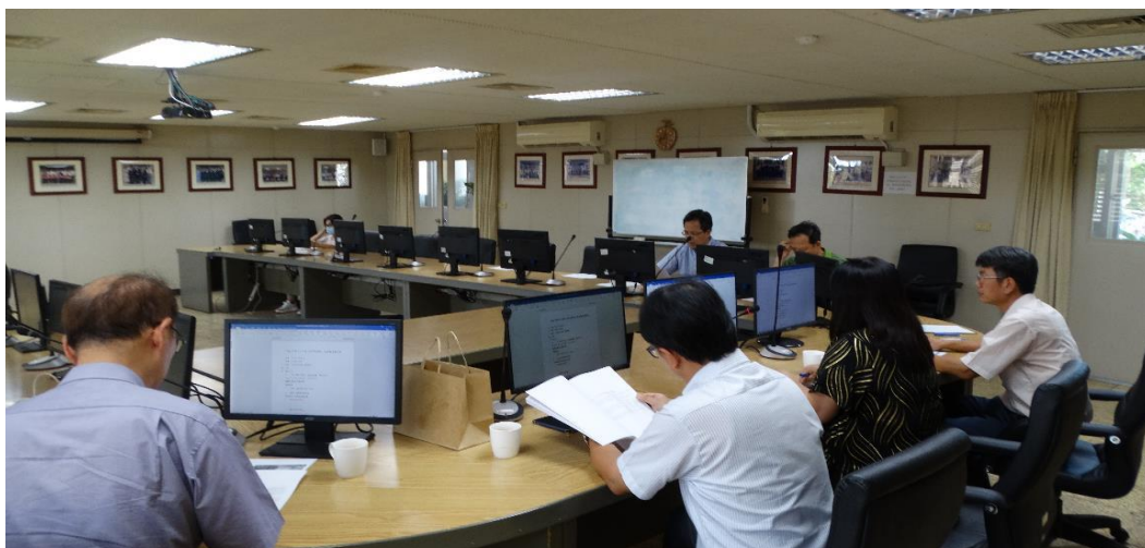
業務視察會議及機關報告