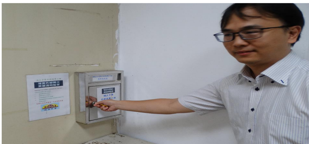
開啟外部視察專用信箱