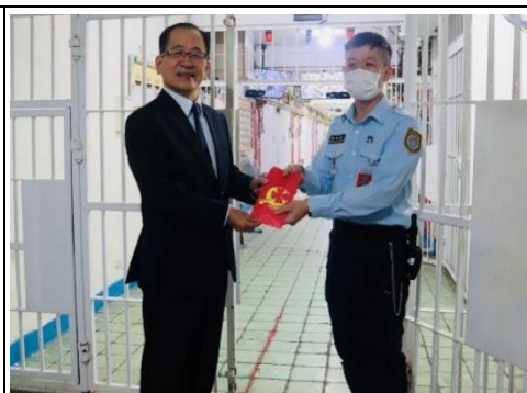
署長致贈同仁禮包