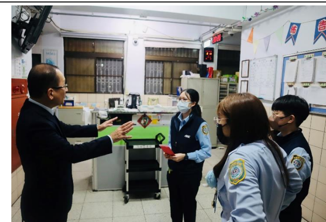
署長關心同仁執勤狀況