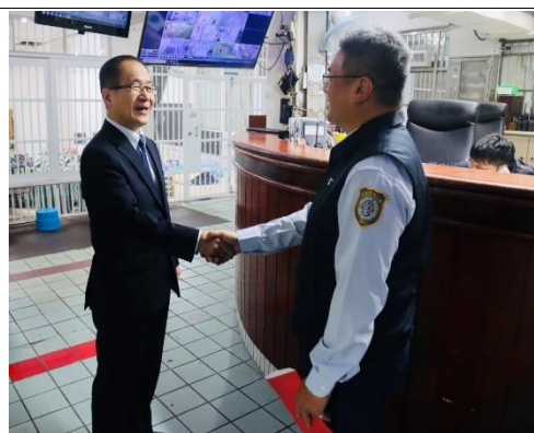
署長勉勵中央台同仁