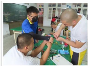
113 年度「職能探索與就業技能訓練課程－室內配線實務」