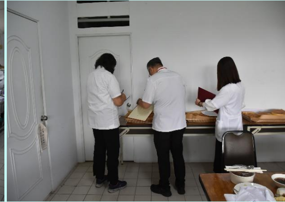
烘焙食品西點蛋糕