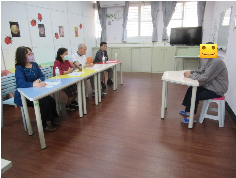
戒治二班受戒治人訪談照片