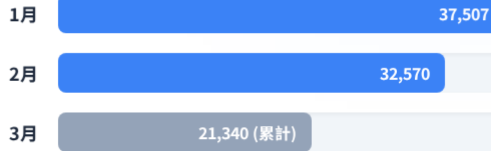
月廚餘總量趨勢 (公斤)

由數據可見，本監推動源頭減量成效發酵，2月份總量較1月份顯著下降約 4,937公 ，每日人均廚餘量亦從 0.50kg 降至 0.49kg，落實精準備餐政策。 斤