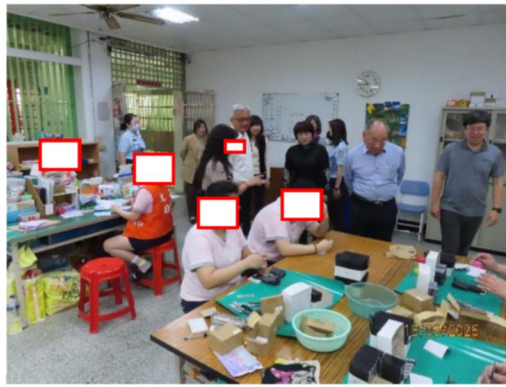
檢視愛滋受刑人工場作業情形