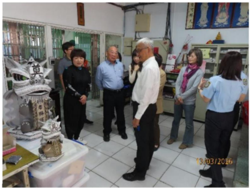
檢視受刑人工場作業情形