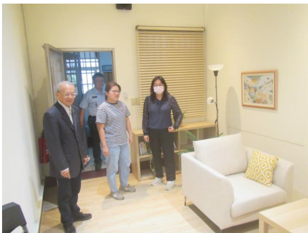
▲視察小組委員參觀收容少年個別輔導室