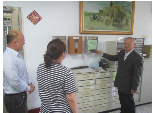
▲委員檢視外部視察小組專用意見箱