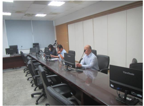
▲所方三位科長與會列席