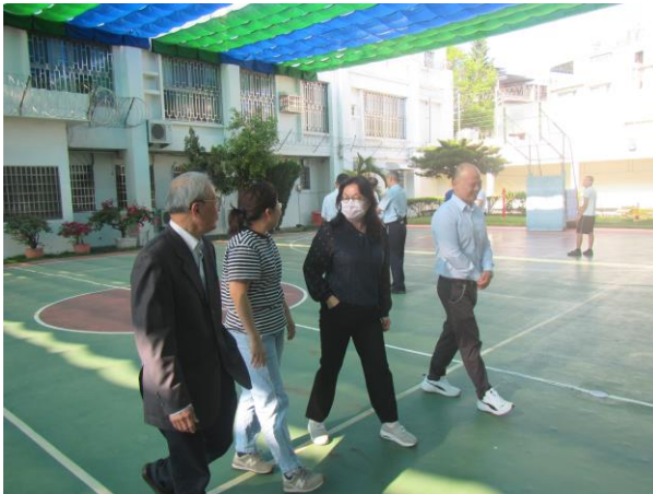
▲視察小組委員進戒護區視察