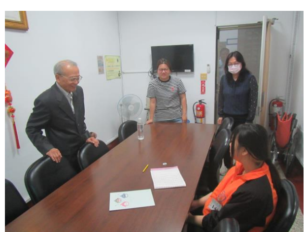
▲視察小組委員關懷勉勵收容少年