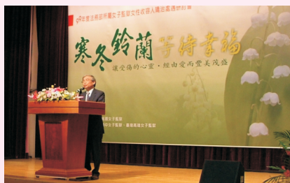
陳次長於研討會開幕致詞

此外，為激發與會者對研討議題的關注，特以研討議題為主軸，呈現「不完整的拼圖」、「化蝶成蛹展翅高飛」二齣收容人話劇作為研討會上、下午場之開